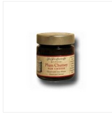
Chutney de ciruelas 6,70 €