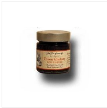
Chutney de cebolla 6,03 €