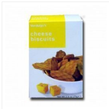
Crackers de Queso 2,75 €