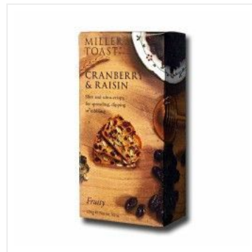
Tostas de Arándan... 5,50 €