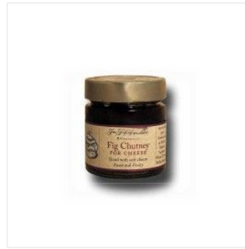
Chutney de higos 6,70 €