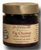
Chutney de higos