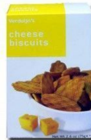
Crackers de Queso