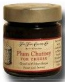
Chutney de ciruelas