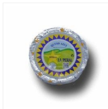
Azul La Peral 7,15 €