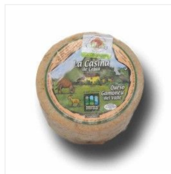
Gamonedo del Valle 11,75 €