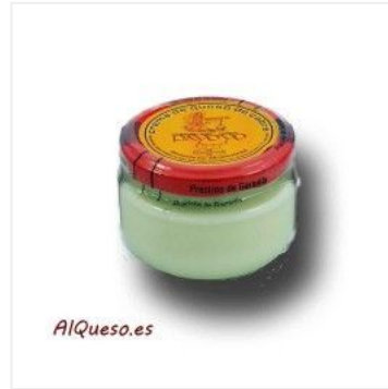
Crema de queso Pa... 4,00 €