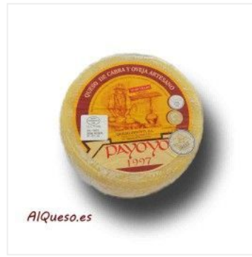
Payoyo de cabra y... 10,25 €