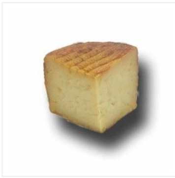
Queso de cabra pa... 14,50 €