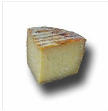
Cabra payoya añej... 13,20 €