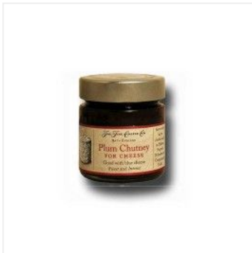
Chutney de ciruelas 5,36 €