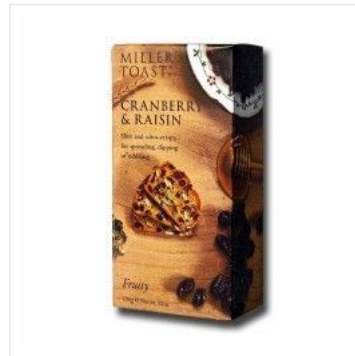
Tostas de Arándan... 5,50 €