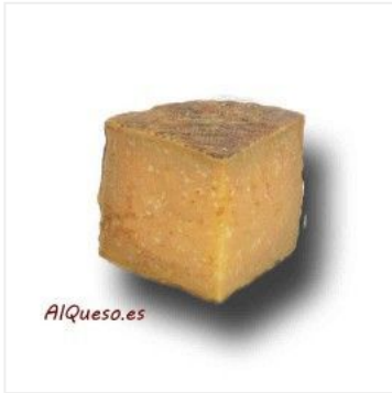
Añejo de cabra pa... 11,56 €