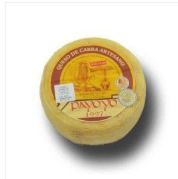
Payoyo artesano d... 11,00 €