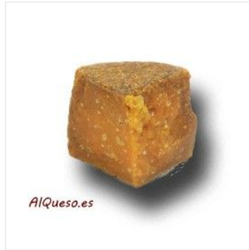
Añejo emborrado d... 14,70 €