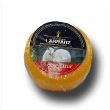
Queso Echegarai 13,50 €