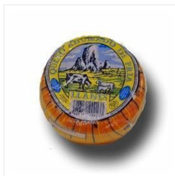
Ahumado de Pría 9,00 €