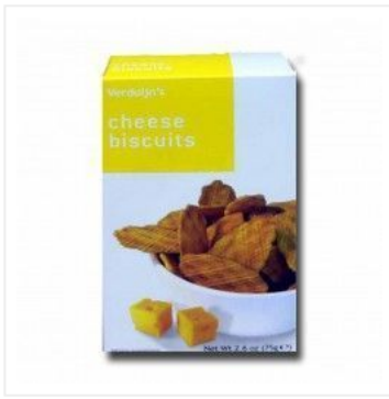
Crackers de Queso 2,75 €