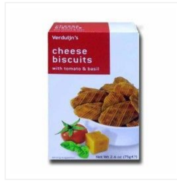
Crackers de Queso... 2,75 €