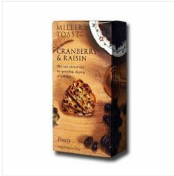
Tostas de Arándan... 5,50 €