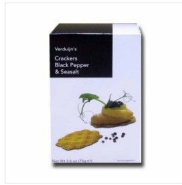
Crackers de Pimie... 2,75 €