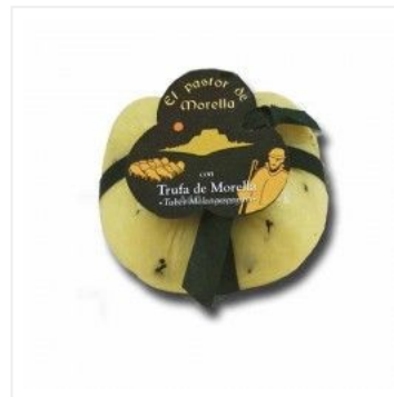
Queso Trufado de ...