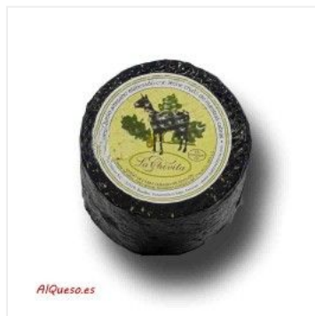
Cabra La Chivita