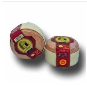
Torta del Casar