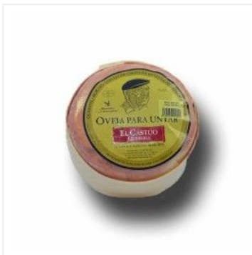
Mini Torta cremos...