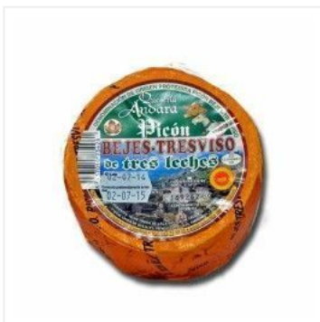
Picón Bejes Tresviso